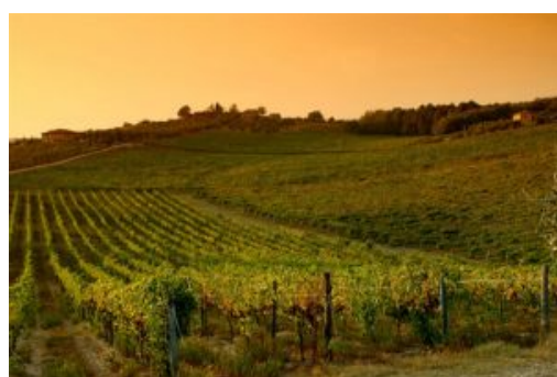
Vigneto in Val d'Orcia

( https://www.agricoltura.it/wp-content/uploads/2016/06/tramonto_vigna_chianti_G.jpg ) Il Consorzio Vino Chianti stima intanto che la produzione 2018 si attesterà sugli 800 mila ettolitri di vino chianti, una quantità leggermente inferiore alla media della produzione che si aggira intorno agli 830-850 mila ettolitri. Niente a che vedere insomma con la forte diminuzione dello scorso anno quando si stimava una perdita di circa il 40% rispetto alle annate "ordinarie". A pesare lo scorso anno sulla quantità di uva erano state la siccità, le gelate primaverili e i danni fatti dagli ungulati: «l'effetto delle calamità 2017 si fanno in alcuni casi ancora sentire – spiega il presidente del Consorzio Vino Chianti Giovanni Busi – la flessione di quest'anno è in parte legata anche alla peronospora (una malattia della vite causata da un fungo che viene a causa di abbondanti piogge) che ha colpito le viti nel mese di maggio, seccando il piccolo grappolo appena nato, che si è diffusa a macchia di leopardo, ma senz'altro ci aspettiamo una ottima produzione in termini qualitativi grazie anche alle ultime piogge che hanno permesso alle viti di allentare la morsa del caldo».